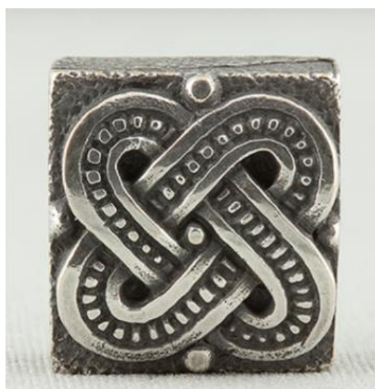
Рисунок 2 – Ліворуч: фрагмент фото Валерія Залужного, який використовували для фейку про нібито нацистську символіку на браслеті; праворуч: елемент браслета у високій роздільній здатності

Інститут масової інформації та Центр протидії дезінформації при РНБО України спростували цю інформацію [2], зазначивши, що вона є частиною інформаційно-психологічної операції (ІПСО), спрямованої на дезорієнтацію та деморалізацію суспільства. Насправді жодних підтверджень «загибелі» Буданова не існувало, а повідомлення були повністю вигаданими та створеними для поширення паніки.