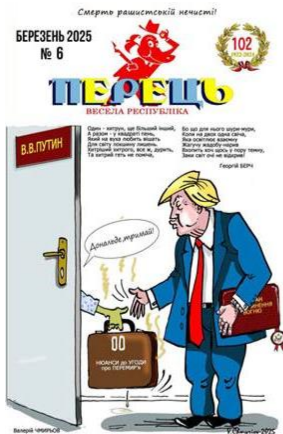
Рис. 3. Карикатури на обкладинці журналу «Перець. Весела республіка»