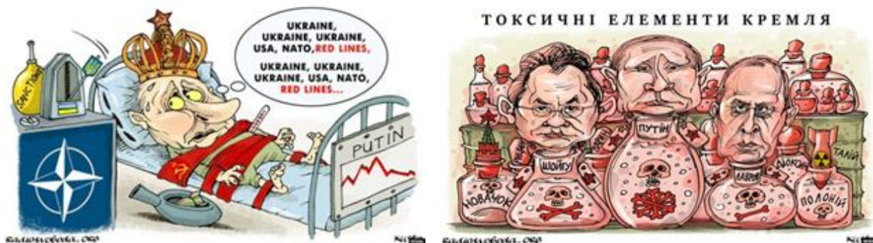
Рис. 1. Приклади політичної карикатури. Радіо «Свобода», автор – Олексій Кустановський

Карикатури різняться за формою, стилем, метою та засобами впливу. Одним із видів карикатур, які часто використовуються в медіа, зокрема й для висвітлення подій російсько-української війни, є політична карикатура. Її мета полягає у тому, щоб висміяти чи покритикувати політичних діячів, ідеї, рішення або дії урядів. Часто героями таких карикатур стають політичні лідери, урядовці, дипломати, депутати парламентів, посадовці міжнародних організацій, військові діячі, інші особи (рис. 1).